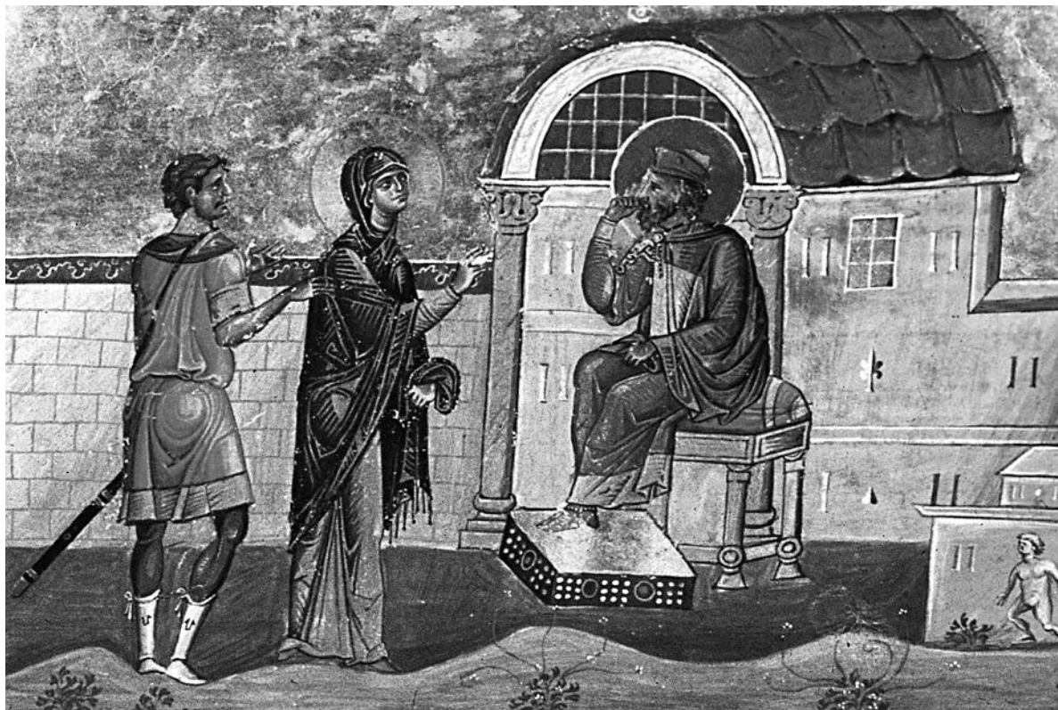
Служение святой мученицы антиохийской диаконисы Поплии (Публии)